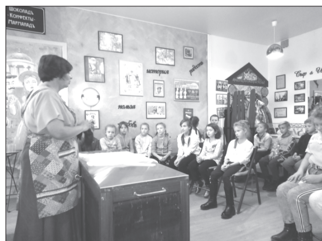
Сладкоежки по достоинству оценили вкус шоколада

В здании музея располагается контактный зоопарк. Сколько было радости, когда дети увидели настоящую утку, которая свободно бегала по комнате и даже по-своему разговаривала с окружающими. Кого там только нет! Попугаи, обезьянки, удавы,