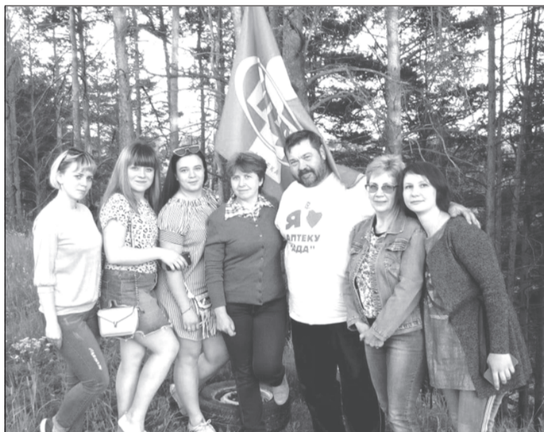
Коллектив аптеки «Ада»