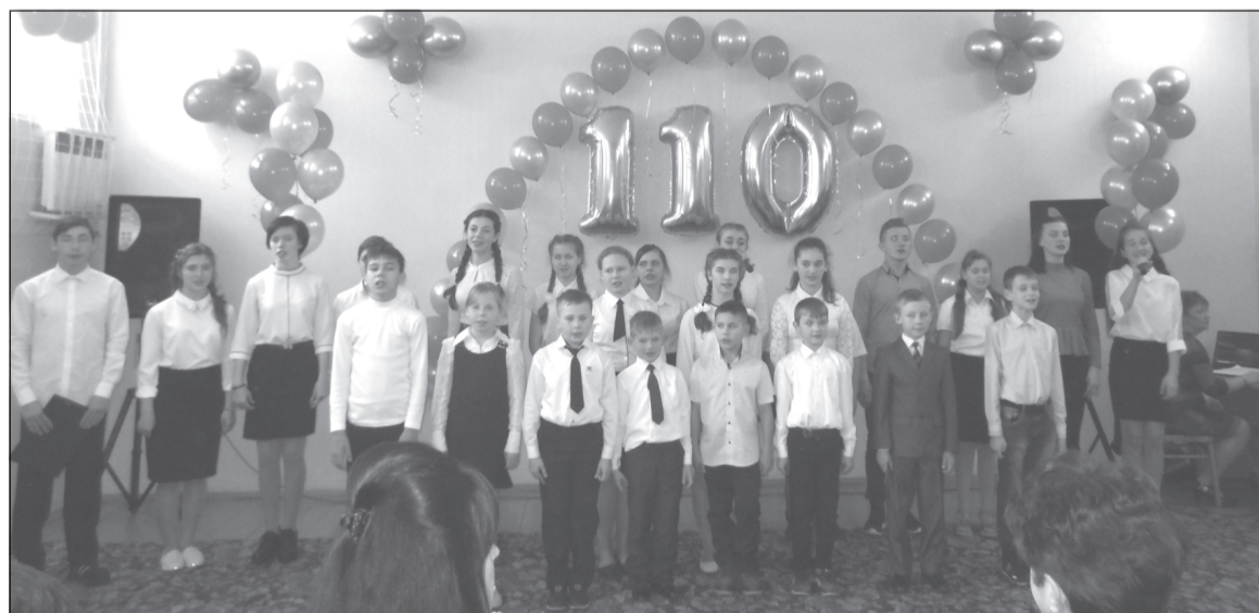
Школа живёт горением детских и учительских сердец, согревающих всех

Спасибо всем за то, что вы нашли время для дружбы! Благодарим всех за радость встреч, за память, за искреннее участие и любовь к школе. Желаем вам