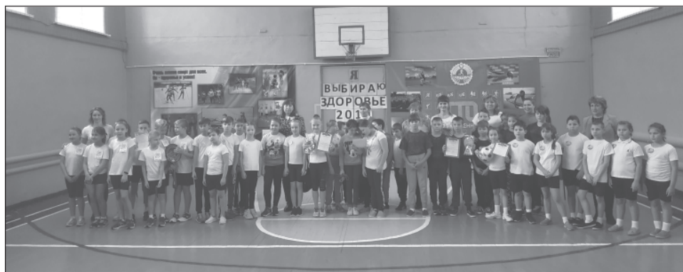
У участников соревнований была возможность вспомнить сказки

1-ое место в соревнованиях заняла команда школы №1; 2-ое - №6; 3 место - №7; Рождественская и школа №12 награждены благодарностями за участие. Все команды получили грамоты и памятные призы.