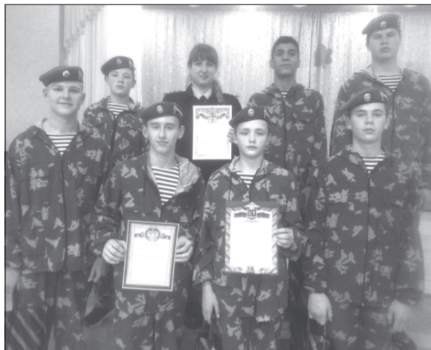
И снова патриоты в числе лучших

В Ивановской гимназии №3 прошёл областной слёт общественных формирований с правоохранительным направлением, посвящённый Дню полиции России.