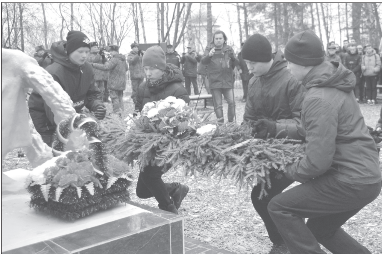
Гирлянду к обновленному монументу возлагают плесские школьники

В минувшую субботу покой Преображенского кладбища в г. Плёсе разорвали звуки выстрелов – они раздались в честь воинов, погибших на фронтах Великой Отечественной войны, умерших от ран, а также звучали салютом всем ещё живым нашим ветеранам-фронтовикам, которым довелось пройти дорогами войны и вернуться домой.