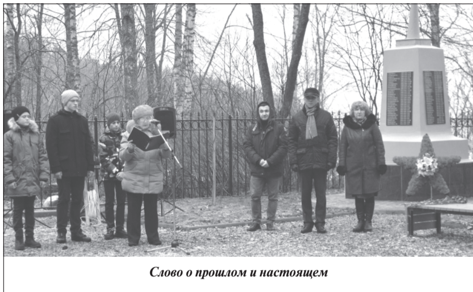
Слово о прошлом и настоящем