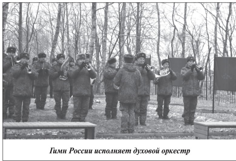
Гимн России исполняет духовой оркестр