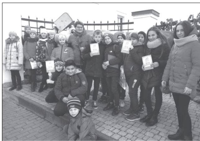
Катание «сырных голов» - это круто!

Ребята школы №12 посетили интерактивный Музей сыра и мастерскую шоколада в г. Кострома.